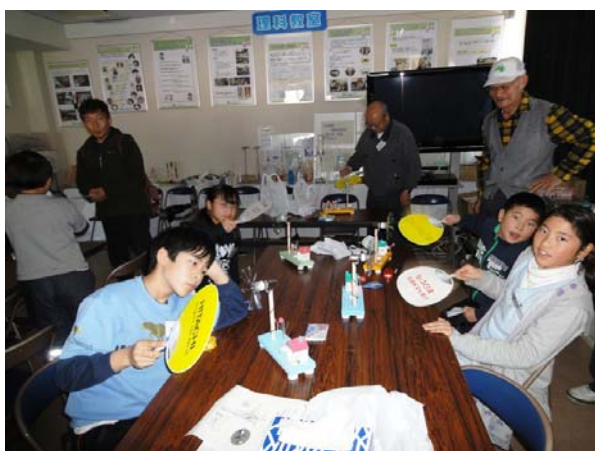
うちわの風力で噴水、LEDのあかり、オルゴールが鳴る