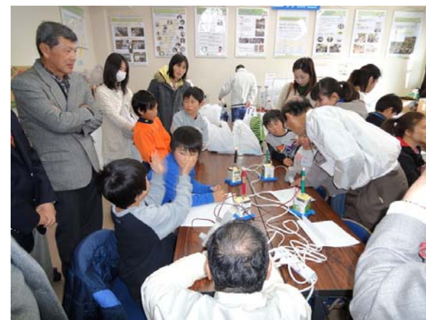
電気パンづくりの実験